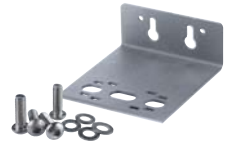
-K DP-壁挂支架 编号 RB7400021