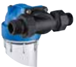
塑料 MP 3/4" and 1"