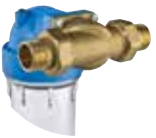
黄铜 MO 1"