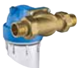
Laiton MO 1"