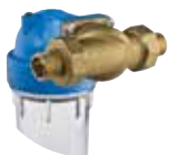
Laiton MO 3/4"