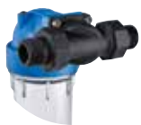
Plastique MP 3/4" and 1"